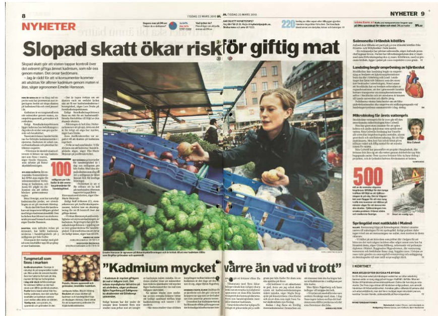
Figur 4b. Exempel på inrikesuppslag i Dagens Nyheter den 23 mars 2010

Som en naturlig konsekvens av ökningen av andelen artiklar med bilder och illustrationer har de visuella inslagens andel av artiklarna också blivit större i flesta tidningarna. Från att i genomsnitt ha utgjort knappt tio procent av nyhetsmaterialet i de formatbytande tidningarna år 2000, hade bildernas utrymme ökat till 15 procent år 2010 (tabell 6). Den största ökningen hittas ånyo inom storstadsmorgonpressen, medan ökning bland lokala morgontidningar är mer blygsam. För Jönköpingspostens del förekommer däremot ingen ökning över tid: bildernas andel av det totala nyhetsmaterialet är i stort densamma som för två decennier sedan.